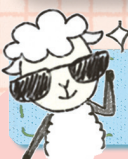
그림 속으로 고고씩~

“○○들은 영원한 ○○을 누리는 곳으로 갈 것이다.” (마태 25,46 참조)